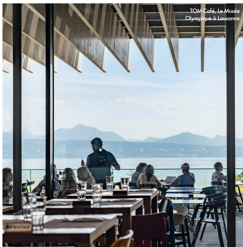
TOM Café, Le Musée Olympique à Lausanne